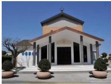
PARROCCHIA SAN GIUSEPPE