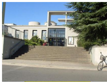
PARROCCHIA SAN GABRIELE