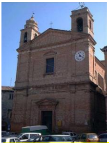
PARROCCHIA SAN PAOLO