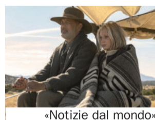
«Notizie dal mondo»

ricani dando lettura di giornali e notizie, portando alla gente piegata da povertà e sofferenze racconti densi di speranza. E che dire poi di Nomadland , il film dell'anno, vincitore a Venezia 77 e poi agli Oscar? Un racconto che invita a «consumare le suole delle scarpe», a condividere l'orizzonte con gli ultimi, che hanno perso tutto ma non si sentono affatto vinti. Nei loro