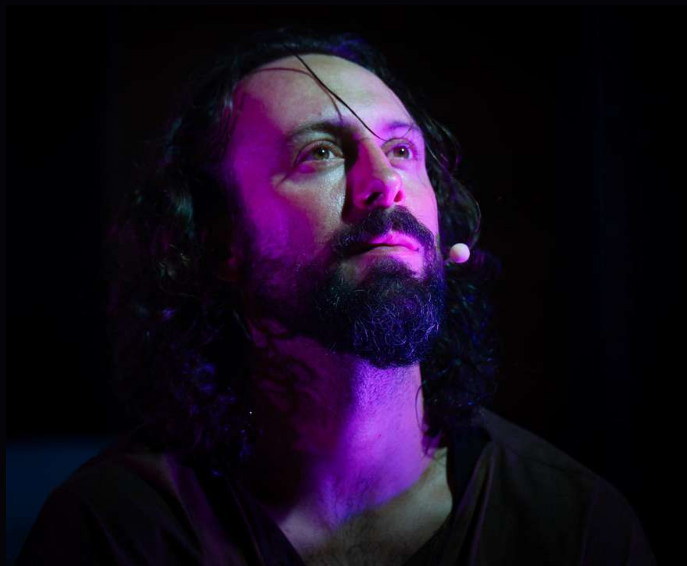
FOTO DI SCENA